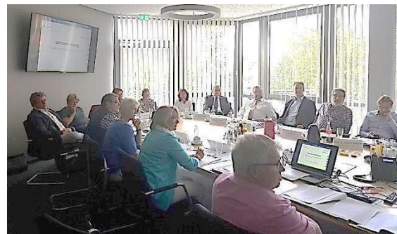
Vorstandssitzung am 17.09.2018 in Minden

In seiner Sitzung im September 2018 hat der Vorstand der VITAL.NRW-Region Mühlenkreis Minden-Lübbecke über vier Projekte entschieden. Folgende Projekte wurden mit einem positiven regionalen Votum versehen und können nun auf den Weg gebracht werden: „Spürnasenpfad auf dem Jakobsberg“ (NHP e.V.), „LandArt Reloaded“ (Kreis Minden-Lübbecke) und „Laurentius-Lädchen Nammen“ (Laurentius-Lädchen Nammen e.V.) Weitere ausführliche Informationen zu allen Projekten finden Sie hier auf unserer Internetseite.