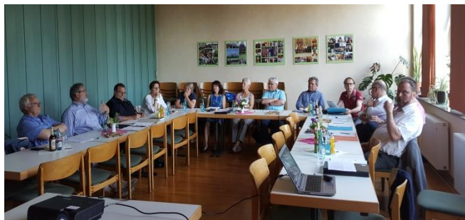
Vorstandssitzung am 14.05.2018 in Oberbauerschaft (Hüllhorst)

In seiner Sitzung im Mai 2018 hat der Vorstand der VITAL.NRW-Region Mühlenkreis Minden-Lübbecke über zwei Projekte entschieden. Unter anderem wurde das Leitprojekt „Intelligente Gebäude – intelligente Region“ im dritten Handlungsfeld mit einem positiven regionalen Votum versehen und kann nun auf den Weg gebracht werden. Weitere ausführliche Informationen zu allen Projekten finden Sie hier auf unserer Internetseite.